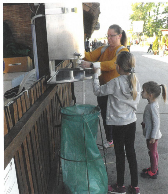
A valamivel kevesebb látogató több tejet fogyasztott

Ilyenkor, amikor három nap alatt több látogató érkezik Hódmezővásárhelyre, mint ahányan a városban laknak, minden lakos és környékbeli magáéna tekint a rendezvényt, sőt, talán az egész megyéről elmondhatni ezt, hiszen Mórahalomtól Szigeden át Makóig minden környékbeli