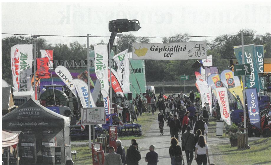
A gépkiallítóknak száma évről évre növekszik

Az év kiemelt lófajtája a gidrán volt, amiből még ehhez képest is várakozáson felüli felhozatalt csodálhattunk meg. A hazai Gidrán Lótenyésztők Magyarországi Egyesületéhez tartozó lovak mellett ha-