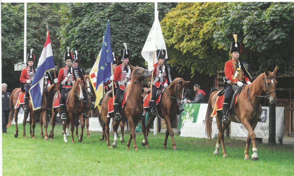
A horvát huszárok látványos bevonulója a megnyitón

Az állattenyésztésben érdekeltek mind jelen voltak Vásárhelyen. A cégek sikeres tárgyalásokat folytattak a két szakmai napon, a legfontosabb partnerek mind végigjárták a kiállítást, hogy meglátogassák üzletfeleiket. Eredményesnek tartották a juh- és bárányhús-fogyasztást népszerűsítő spanyol-magyar rendezvényt, valamint a Magyar Állatorvosok Világszövetségének elnöki ülésén részt vevők is elismeréssel nyilatkoztak, amin öt ország magyar régi-